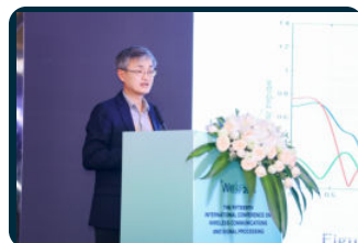
IEEE fellow、多伦多大学教授 Wei Yu